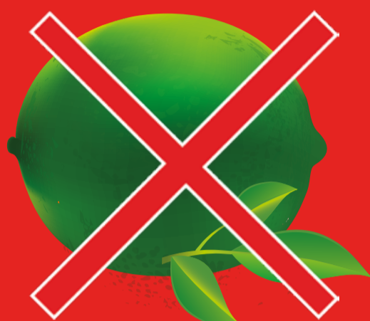
Citrons et autres agrumes