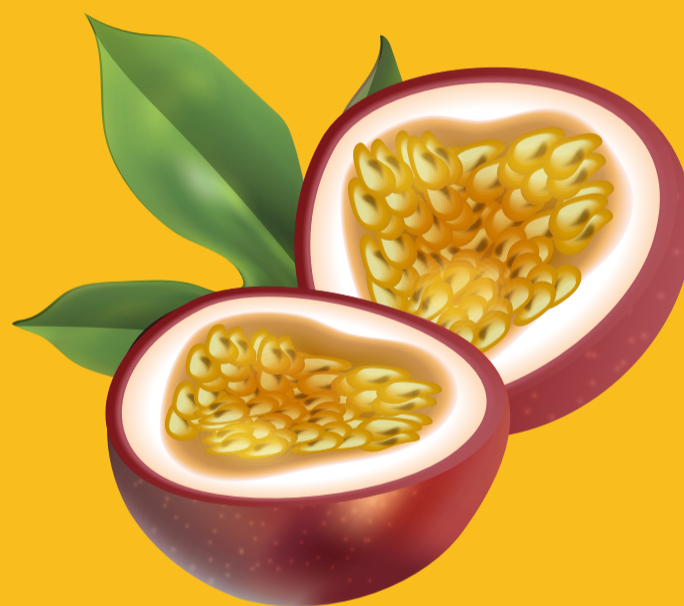
Fruits de la passion