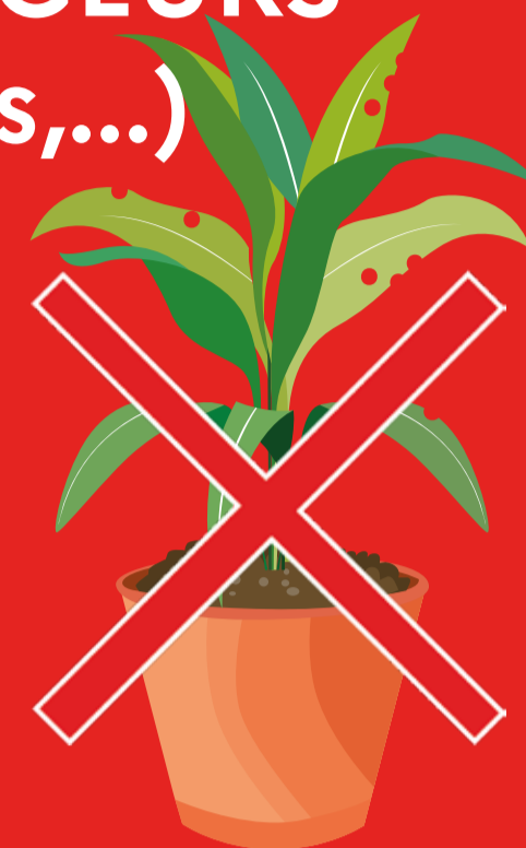
Boutures et plants