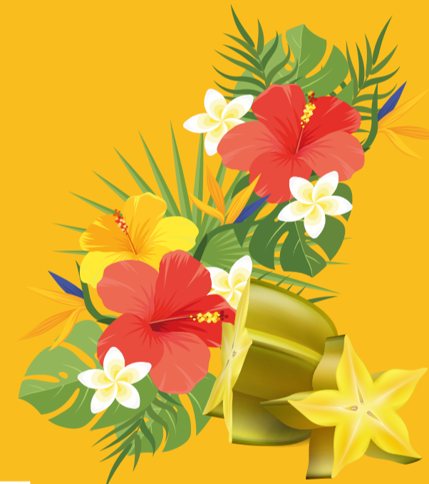
Tout autre végétal

SONT AUTORISÉS SANS RESTRICTION DE POIDS ET SANS FORMALITÉ PRÉALABLE :